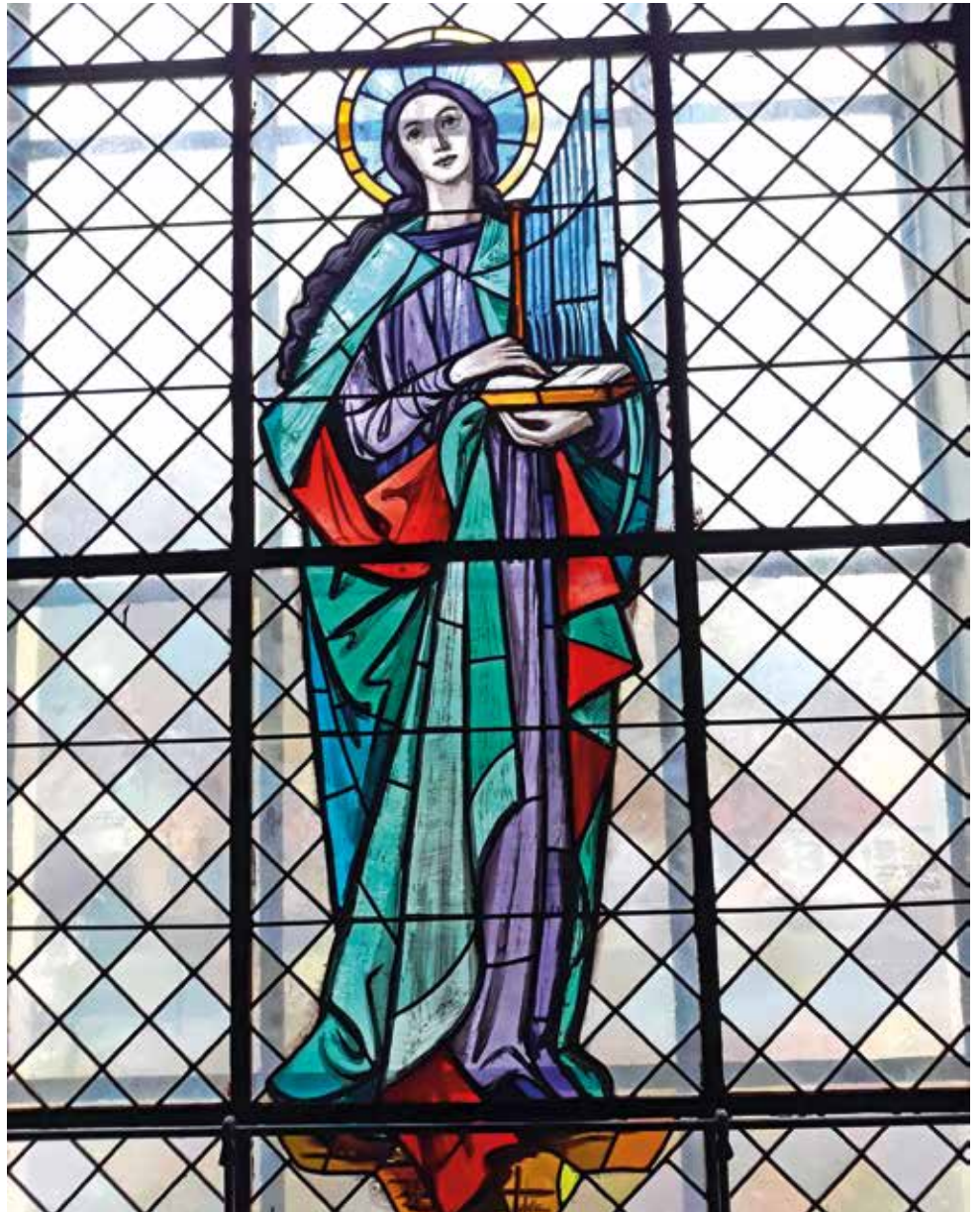
Heilige Cäcilia, Emporenfenster in der Pfarrkirche Wies

Erst im 4. Jh. hat Bischof Ambrosius von Mailand erste liturgische und musikalische Reformen in seinem Bereich durchgeführt. Ende des 6. Jh's. reformierte Papst Gregor der Große die Liturgie. Der gregorianische Choral wird einstimmig vorgelesen und basiert auf lateinischen Gebetstexten. Im 9.Jh. baute man, nach orientalischen Vorlagen die erste Orgel in Aachen, sie avanciert zum königlichen Instrument der Kirchenmusik. Ab der Barockzeit wurde, wie das Leben bei Hof, auch die Kirchenmusik immer pompöser. In der Folge werden bis zur Neuzeit herauf viele großartige Messen von bedeutenden Musikern komponiert. Sie werden heute noch zu besonders feierlichen Anlässen aufgeführt.