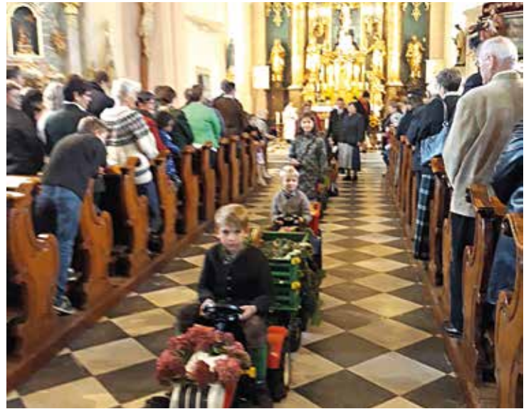
Der Erntezug wurde wieder von Traktoren und Erntewagen angeführt