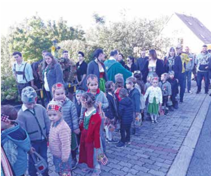
Die Kindergartenkinder von St. Ulrich freuen sich, ebenfalls einen Beitrag zum Erntedankfest leisten zu dürfen.