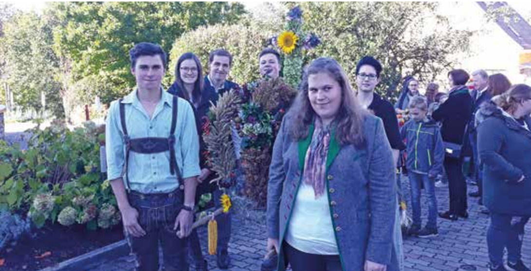
Die Landjugend St. Ulrich präsentiert, vor dem Kräutergarten, die von ihnen gebundene Erntekrone.