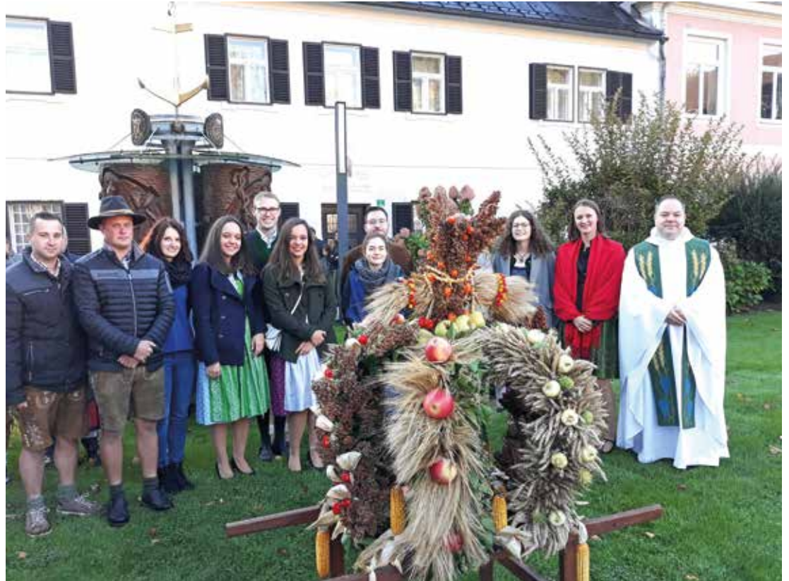
Sehr erfreut über ihre gelungene Arbeit zeigte sich die Landjugend von Wies

In der wunderschönen Herbstzeit durften wir auch wieder unsere Erntedankfeste feiern. Mit großem Engagement wurden wieder die Erntekronen vorbereitet und in die Kirche getragen. Der Dank gilt dabei der Landjugend Wies und St. Ulrich sowie der Dorfgemeinschaft Brunndorf für das binden der Erntekronen. Herzlichen Dank auch allen die mit einem Beitrag beim Gottesdienst diesem Fest eine besondere Note verliehen. Das vielfältige Engagement, vor allem auch das der Kinder, kann aus den Fotos hier entnommen werden.